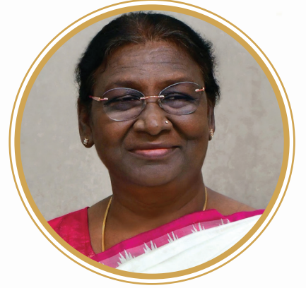
Smt. Droupadi Murmu President of India

राष्ट्रपति भारत गणतंत्र PRESIDENT REPUBLIC OF INDIA